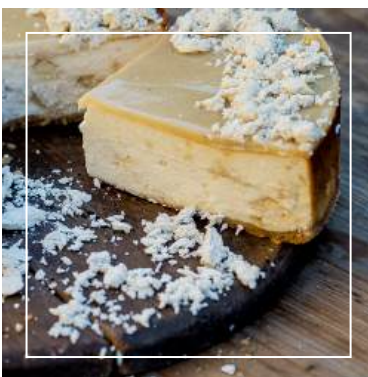
SERNIK Z CHAŁWĄ 125 zł / średnica 22 cm