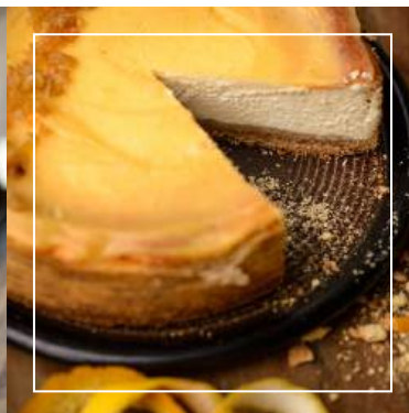
SERNIK SZEFA Z NUTĄ POMARAŃCZY 135 zł / średnica 22 cm