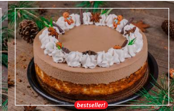
SERNIK KORZENNY Z MUSEM CZEKOLADOWYM 156 zł / średnica 22 cm