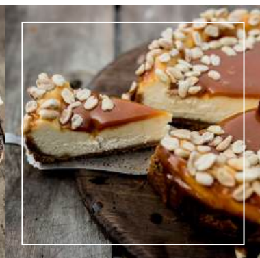
SERNIK Z KARMELEM I ORZECHAMI 135 zł / średnica 22 cm