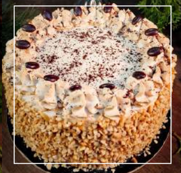
TORT ORZECHOWY Z KAWĄ 160 zł / średnica 22 cm