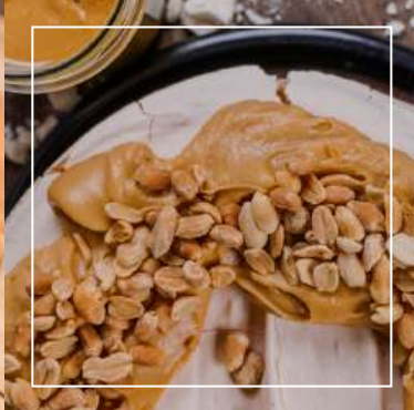
BEZA Z MASŁEM ORZECHOWYM 154 zł / średnica 22 cm