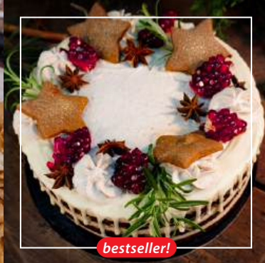
TORT PIERNIKOWY Z POWIDŁAMI ŚLIWKOWYMI 165 zł / średnica 22 cm