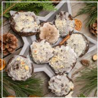
PIERNIKI SZEFA Z BAKALIAMI od 16 zł / paczka