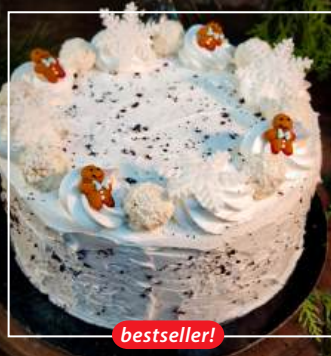
TORT MAKOWY Z BIAŁĄ CZEKOLADĄ 180 zł / średnica 22cm