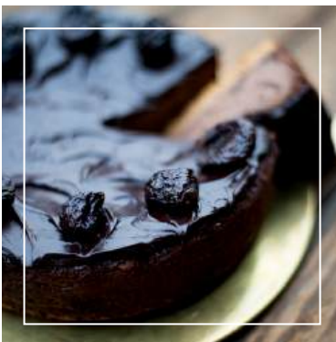
SERNIK ŚLIWKA W CZEKOLADZIE Z RUMEM 188 zł / średnica 22 cm