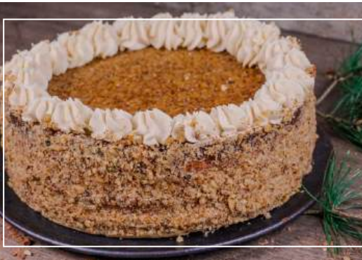
MIODOWNIK Z ORZECHAMI WŁOSKIMI (VEGAŃSKI) 182 zł / średnica 26 cm