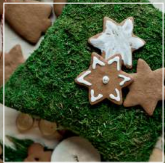
PIERNIKI KORZENNE od 9 zł / paczka