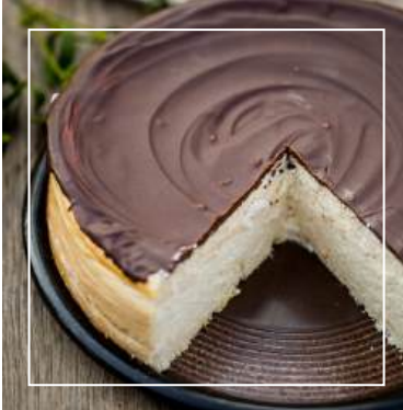
SERNIK WIEDEŃSKI 160 zł / średnica 24 cm