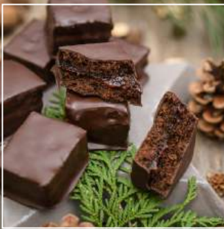
KOSTKA PIERNIKOWA od 17 zł / paczka