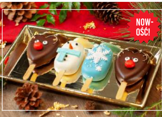
ZESTAW ICE CAKE POPSÓW: „MIKOŁAJEK” malina z mascarpone x2 , krówka x2 4 szt / 48 zł