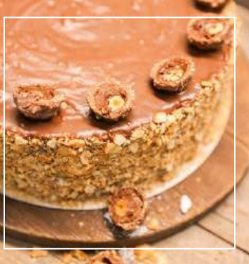
TORT ZŁOTA PRALINKA 215 zł / średnica 24 cm