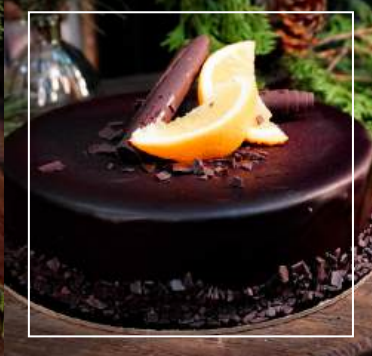
TORT POMARAŃCZOWY Z CZEKOLADĄ 170 zł / średnica 22 cm