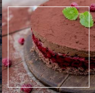
DELICJA MALINOWA 149 zł / średnica 26 cm