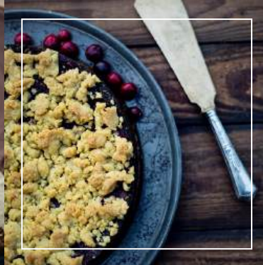
MAKOWIEC Z ŻURAWINĄ 115 zł / średnica 22 cm